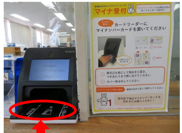
ここにマイナンバーカードを置いてください

マイナンバーカードを保険証として利用するための登録がまだの場合は、この時点で登録画面が表示されます。