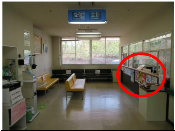
顔認証付きカードリーダーは受付窓口に設置してあります